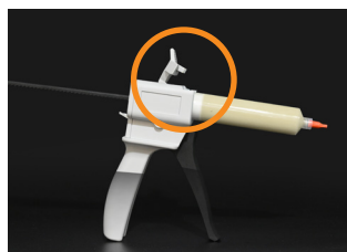
③ Close the cover.