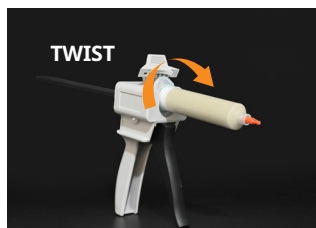
② Put the tube in and twist.