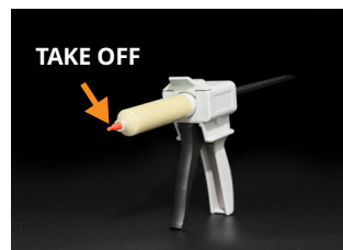
④ Take off the plug.

(圖中操作步驟所展示的膠泥僅供示意 The putty in the picture does not represent the actual product.)