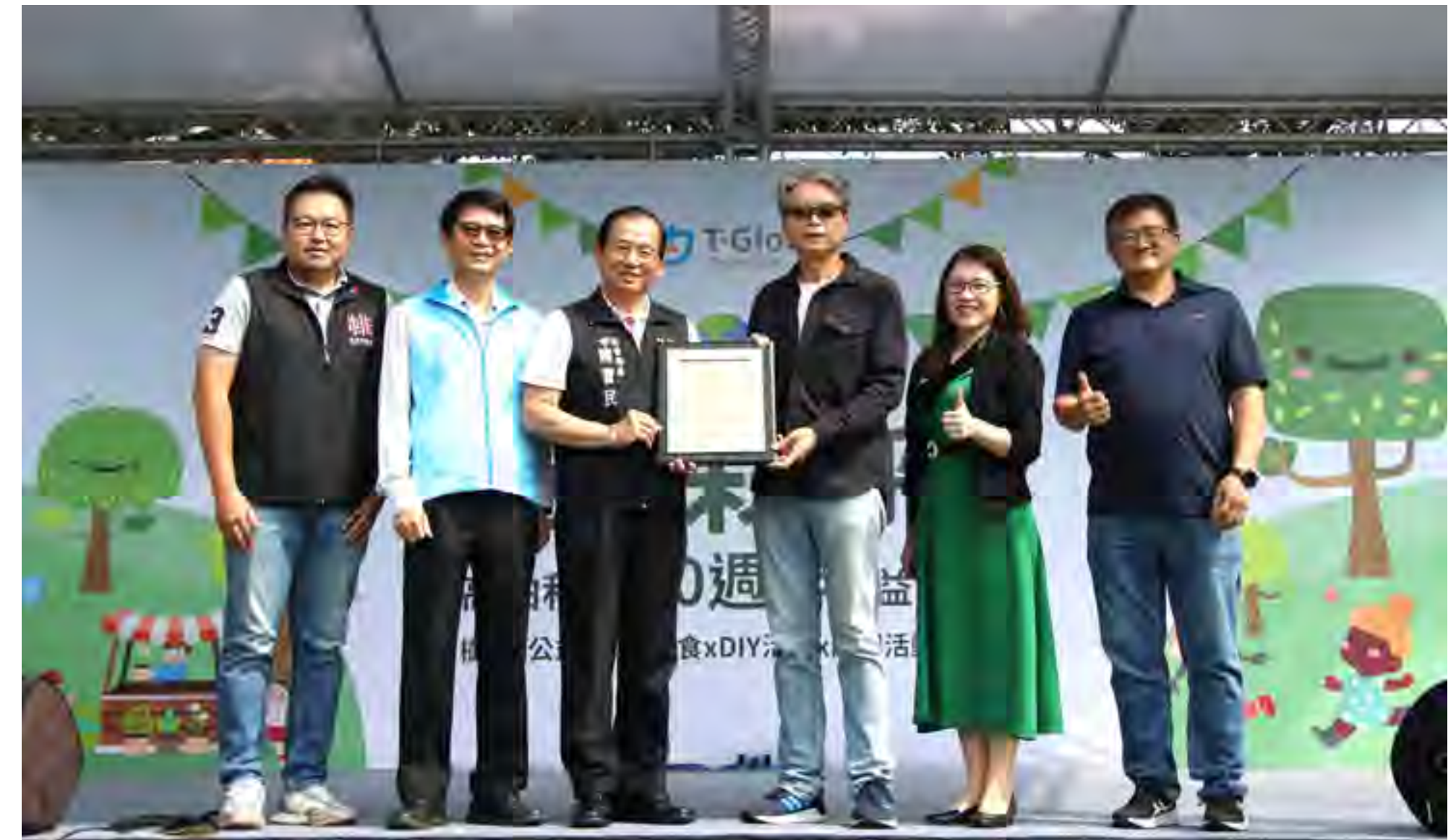
公益園遊會 - 感謝合照

20 週年公益園遊會，不僅為民眾帶來一場歡樂的園遊體驗，更傳遞重要的環境保護理念。相信我們的持續努力下，一定能為地球環保帶來更多正面的影響。高柏科技 20 週年公益園遊會，是企業履行社會責任的具體實踐，也為高柏科技營造更好的企業形象。相信在各界企業與民眾的共同努力下，我們一定能共創更美好的永續未來。