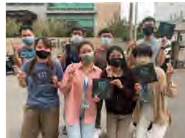
關燈一小時 - 合照