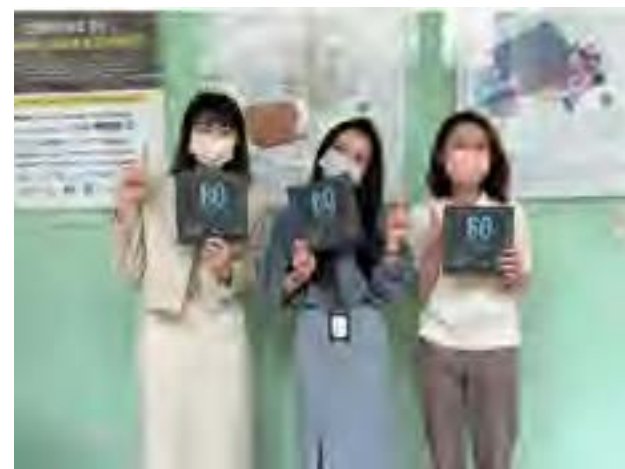
關燈一小時 - 合照