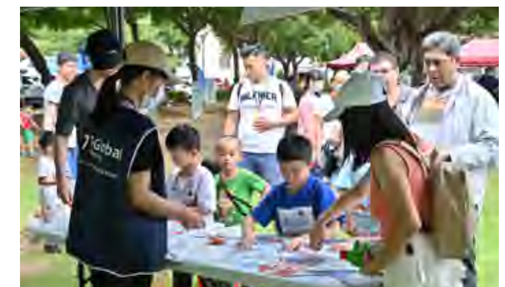
公益園遊會 - 永續教育闖關活動