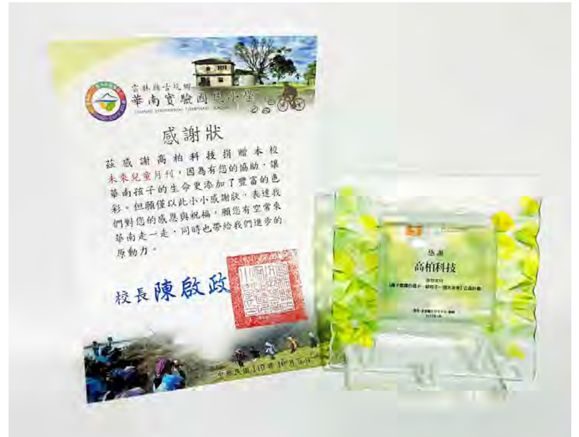
播下閱讀的種子 - 給孩子一個大未來 公益計畫

此外，這也是我們落實 ESG（環境保護、社會責任及公司治理）企業永續發展的重要指標之一。教育是社會進步的基石，而支持教育發展則是實現永續發展的關鍵。通過這些具體的行動，我們希望能夠帶動更多的企業和社會力量一起參與，共同為台灣的教育事業貢獻力量。我們期盼，藉由協助資援台灣教育，能讓越來越多的孩子們享受閱讀的樂趣，並從中獲得成長的力量。高柏科技將繼續堅持這一使命，為台灣的未來培養更多有能力、有信心的年輕一代。讓我們共同努力，讓每一個孩子都有機會透過閱讀，看到更加光明的未來。