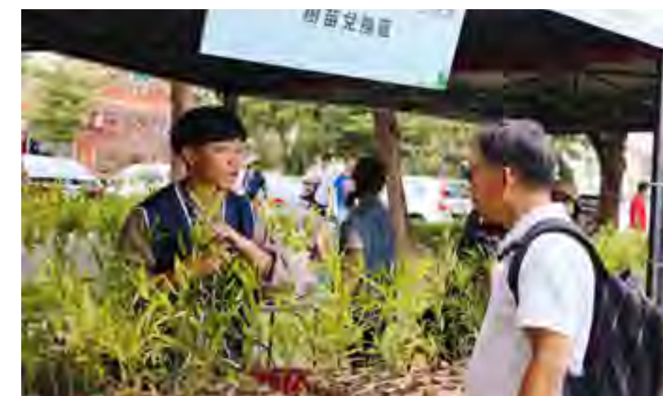
公益園遊會 - 贈送樹苗