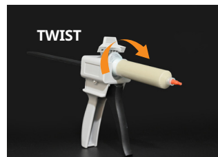
② Put the tube in and twist.