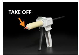
④ Take off the plug.

(图中操作步骤所展示的胶泥仅供示意 The putty in the picture does not represent the actual product.)