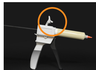
③ Close the cover.